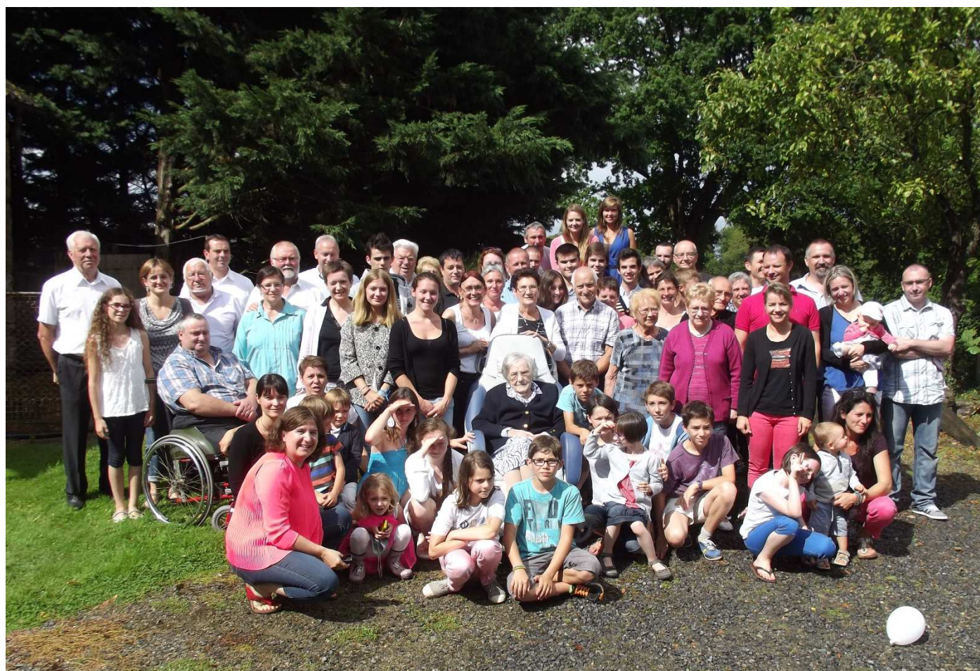
Notre centenaire germinoise entourée de toute sa famille